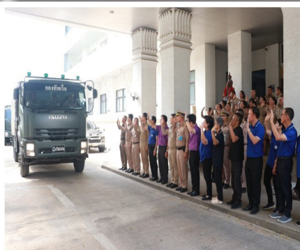
ภาพที่ ๒ กลุ่มสมาคมการประมงจังหวัดต่าง ๆ จัดเตรียมปลาและอาหารทะเล และจัดพิธีส่งมอบให้กับผู้แทนกองทัพเรือ เพื่อเดินทางไปส่งมอบอาหารทะเลพระราชทาน