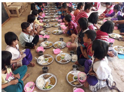
ภาพที่ ๗ เด็กนักเรียนในศูนย์การเรียนรู้ฯ ในพื้นที่ อ.อมก๋อย จว.เชียงใหม่ รับประทานอาหารกลางวัน