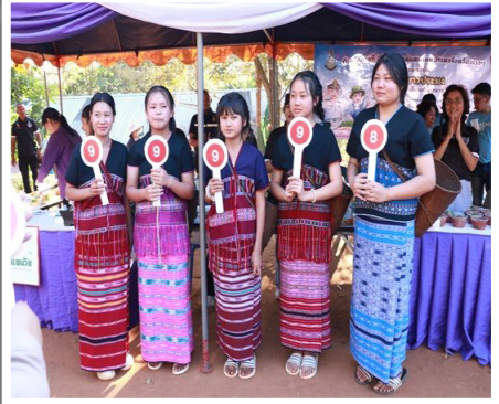
ภาพที่ ๔ กิจกรรมพิเศษเนื่องในโอกาสครบรอบ ๓๐ ปี