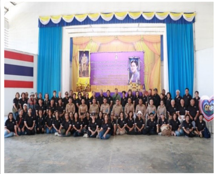
ภาพที่ ๓ พิธีส่งมอบปลากะตักแห้ง ปลาทุเค็ม และอาหารทะเลที่มีสารไอโอดีนพระราชทาน ณ หอประชุม ที่ว่าการ อ.อมก๋อย จว.เชียงใหม่ เมื่อ ๕ ก.พ.๖๙