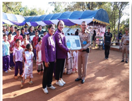
ภาพที่ ๕ คณะเยี่ยมศูนย์การเรียนรู้ชุมชนชาวไทยภูเขาแม่ฟ้าหลวง บ้านห้วยปูหลวง ชมการแสดงของนักเรียน จัดเลี้ยงอาหารกลางวัน และมอบอุปกรณ์จำเป็นการศึกษา และอุปกรณ์กีฬา เมื่อ ๕ ก.พ.๖๙