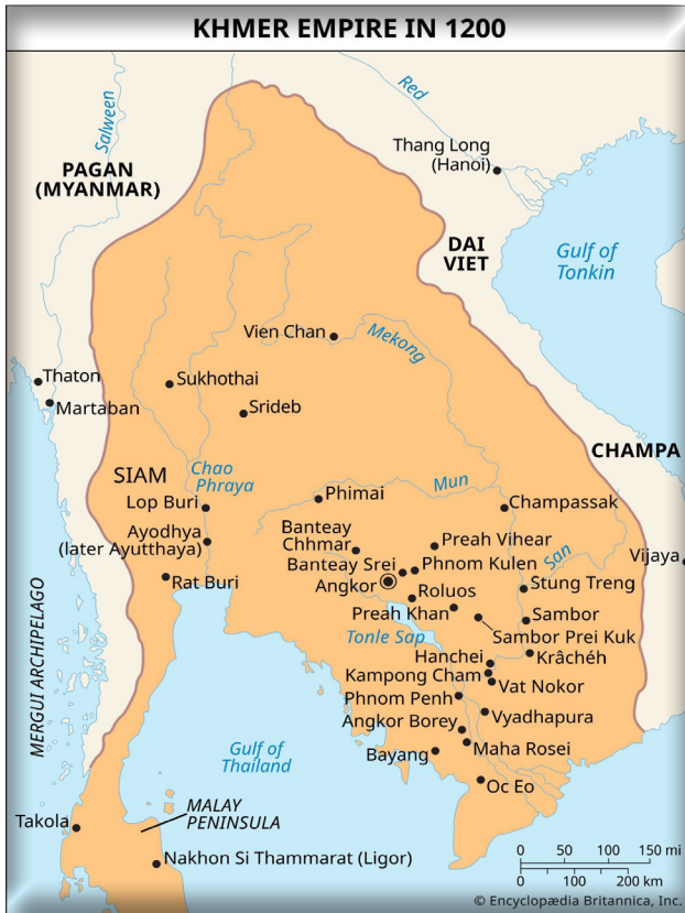
รูปที่ ๑ อาณาจักรพระนคร (Angkor Empire หรือ Khmer Empire) ในพุทธศตวรรษที่ ๑๘ เป็นยุคที่รุ่งเรืองที่สุด ครอบคลุมพื้นที่ส่วนมากของ ไทย ลาว กัมพูชา และเวียดนาม ในปัจจุบัน