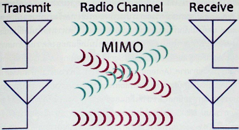
ภาพที่ ๑ หลักการสื่อสารแบบ MIMO