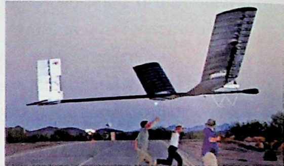
ภาพที่ ๓ SOLAREAGLE (ซ้ายมือ) และ ZEPHYR (ขวามือ)