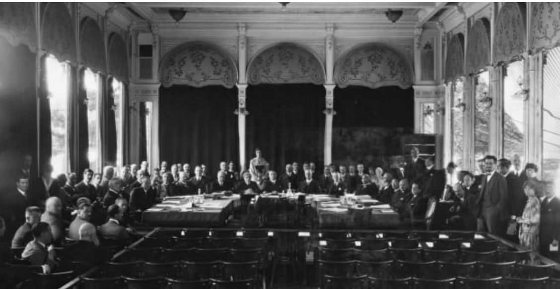
ภาพการก่อตั้งสันนิบาตชาติที่เป็นผลมาจากหลัก ๑๔ ประการ และสนธิสัญญาแวร์ซาย

ผลกระทบต่อระบบเศรษฐกิจของประเทศต่าง ๆ ในยุโรปอย่างมาก ในไม่กี่ปีหลังจากนั้น วูดโรว์ วิลสัน ประธานาธิบดีคนที่ ๒๘ ของสหรัฐอเมริกา ซึ่งดำรงตำแหน่งในช่วงเวลาดังกล่าว (ค.ศ.๑๙๑๓ - ๑๙๒๑) ได้มีบทบาทสำคัญอย่างยิ่งในการผลักดันแนวความคิดเสรีนิยมของตน (Wilsonian) ผ่าน “หลัก ๑๔ ประการ” ซึ่งเป็นข้อเสนอสำคัญในสนธิสัญญาแวร์ซาย ๕ ที่ฝ่ายสัมพันธมิตรเรียกว่าเป็นสัญญาสันติภาพที่บังคับให้ฝ่ายอักษะนำโดยจักรวรรดิเยอรมนีลงนามแสดงสถานะการยุติสงครามโลกครั้งที่ ๑ โดยมีสาระสำคัญพื้นฐานคือ ความพยายามทำให้สังคมโลกอยู่ในความสงบและมีความมั่นคงและสันติภาพ และให้มีการตั้งกฎเกณฑ์เพื่อป้องกันและลงโทษประเทศที่ก่อสงครามขึ้นผ่านกลไกความร่วมมือจากนานาชาติ หลัก ๑๔ ประการ จึงเป็นรากฐานของการจัดตั้งองค์การเพื่อความมั่นคงในระดับโลกในสมัยนั้นขึ้นมา คือ สันนิบาตชาติ (League of Nations) เพื่อเป็นตัวแทนในการจัดระเบียบโลกในช่วงเวลาดังกล่าว