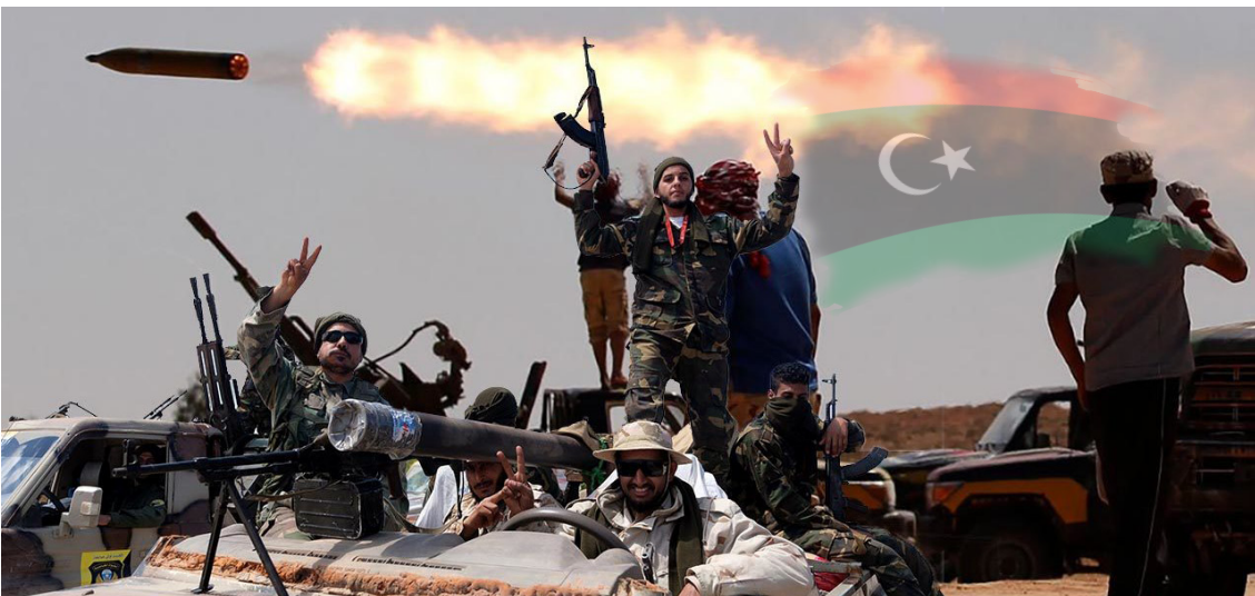
ภาพสงครามกลางเมืองในลิเบีย

ในการปกป้องประชาชนของตนให้พ้นจากอาชญากรรมร้ายแรง ๔ ประเภท ได้แก่ การฆ่าล้างเผ่าพันธุ์ (Genocide) อาชญากรรมสงคราม (War Crimes) อาชญากรรมต่อมนุษยชาติ (Crimes Against Humanity) และการกวาดล้างกลุ่มชาติพันธุ์ (Ethnic Cleansing) แต่หากรัฐบาลนั้นกลับเพิกเฉยหรือสนับสนุนให้มีการกระทำดังกล่าว นานาชาติสามารถเข้าให้ความช่วยเหลือได้ โดยไล่ระดับไปตั้งแต่การไกล่เกลี่ย ตักเตือน หรือประณาม การแทรกแซงทางเศรษฐกิจ ไปจนถึงการบังคับให้เกิดสันติภาพตามกฎหมายมาตราที่ ๗ โดยหลักการทั้งการแทรกแซงเพื่อมนุษยธรรม และ R2P ถูกใช้เป็นเครื่องมือสำหรับการสร้างความร่วมมือระหว่างนานาชาติในการสร้างความมั่นคงของมนุษย์ ตามภูมิภาคต่าง ๆ เนื่องจากภัยคุกคามดังกล่าวกลายเป็นที่ปรากฏการณ์ที่พบมากขึ้น ในยุคหลังสงครามเย็น ความขัดแย้งระหว่างรัฐกลายเป็นปัญหาที่สะสมและมักเริ่มต้นขึ้น ภายในประเทศที่รัฐบาลเจ้าบ้าน (Host Government) ไม่สามารถแก้ไขปัญหาการละเมิดสิทธิมนุษยชนในประเทศตนเองได้อย่างมีประสิทธิภาพและทันเวลามากพอ ยกตัวอย่างเช่น กรณีการฆ่าล้างเผ่าพันธุ์ในรวันดา (ค.ศ.๑๙๙๓) เหตุการณ์การความรุนแรงในติมอร์ตะวันออก (ค.ศ.๑๙๙๙) หรือสงครามกลางเมืองในลิเบีย (ค.ศ.๒๐๑๑) รวมไปถึงกรณีที่ปัญหาหรือความขัดแย้งที่ขยายตัวออกไปสู่ภูมิภาคข้างเคียง เช่น ปัญหาการย้ายถิ่นฐานแบบไม่ปกติ (Irregular Human Migration) เช่น ปัญหาผู้อพยพชาวโรฮิงยาในมหาสมุทรอินเดีย ปัญหาโจรสลัดในอ่าวเอเดน มหาสมุทรอินเดีย และในช่องแคบมะละกา