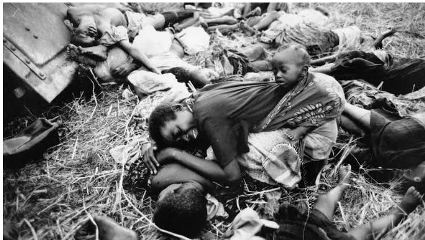
ภาพหนึ่งในความล้มเหลวของภารกิจรักษาสันติภาพของ UN ในการหยุดยั้งการฆ่าล้างเผ่าพันธุ์ในรวันดา ค.ศ.๑๙๙๔

เมื่อสถานการณ์เปลี่ยนแปลงไป ซึ่งการที่ UNAMIR ไม่ปรับอำนาจของภารกิจตามสถานการณ์ที่มีความรุนแรงขึ้น ซึ่งกองกำลังรักษาสันติภาพที่เข้าไปในพื้นที่ที่มีอำนาจของภารกิจเพียงการบรรเทาทุกข์ด้านมนุษยธรรมเท่านั้น ซึ่งเป็นไปตามการใช้กฎบัตรฯ มาตราที่ ๖ และการแทรกแซงเพื่อมนุษยธรรมเท่านั้น แต่ไม่มีอำนาจที่สามารถใช้กำลังบังคับให้เกิดสันติภาพได้ กองกำลังดังกล่าวจึงเป็นเพียงกำลังพลที่ขาดประสบการณ์และความชำนาญในการรับมือกับสถานการณ์ที่เป็นสงครามกลางเมืองขนาดใหญ่จากการฆ่าล้างเผ่าพันธุ์ชาวทูตซีโดยชาวฮูตูกำลังจะเกิดขึ้น รวมทั้งยังขาดการสนับสนุนจากชาติมหาอำนาจในคณะมนตรีความมั่นคงฯ ด้วยสาเหตุที่ประเทศรวันดาเป็นพื้นที่ห่างไกลจากผลประโยชน์ของชาติมหาอำนาจ ทำให้กว่าจะมีมติคณะมนตรีความมั่นคงฯ ปรักัดอุปสรรคของการปฏิบัติการรักษาสันติภาพเป็นภารกิจใหม่ (United Nations Assistance Mission for Rwanda: UNAMIR II ค.ศ.๑๙๙๔) ก็สายเกินไปจนเกิดเหตุการณ์ร้ายแรงต่อชาวรวันดาอย่างที่ปรากฏในหน้าประวัติศาสตร์เสียแล้ว