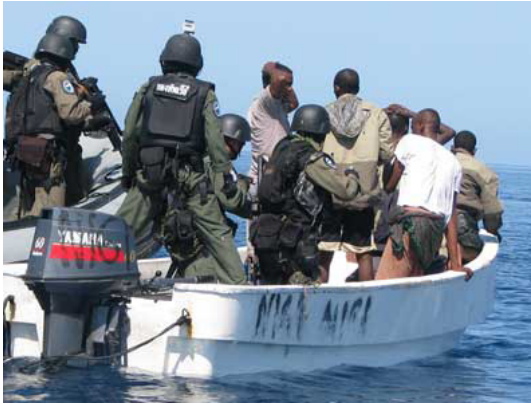
ภาพส่วนหนึ่งของการปฏิบัติการของหมู่เรือปราบปรามโจรสลัด