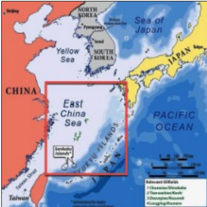
ภาพที่ ๒

อันใกล้และอาจจะลุกลามบานปลายทำให้จีนสามารถบรรลุวัตถุประสงค์ทางทหารและสามารถครอบงำในเขตแดนของญี่ปุ่นที่อยู่ห่างไกลจากประเทศแม่ก็เป็นได้