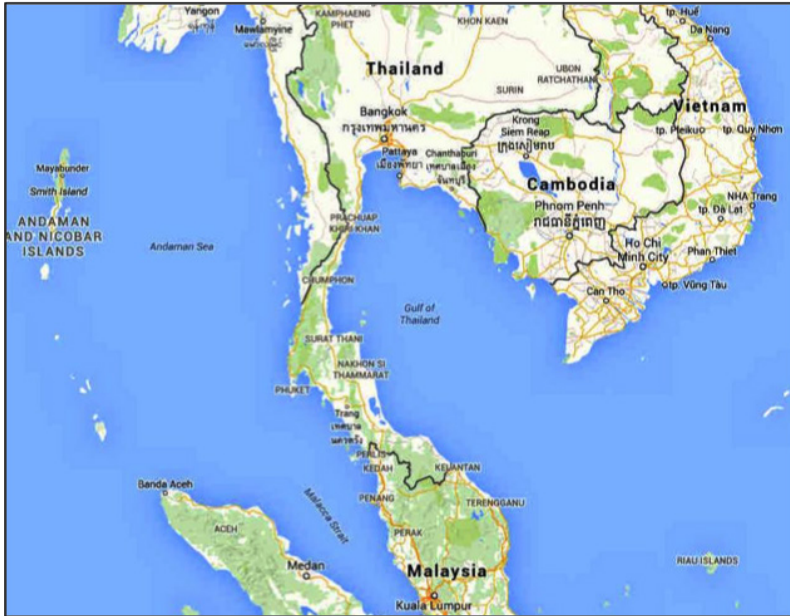
ภาพที่ ๓

ต่อเศรษฐกิจของประเทศอย่างรุนแรง ดังนั้น การพัฒนาทางยุทธศาสตร์ สำหรับกิจการทหารเรือจึงมีความจำเป็นและสำคัญยิ่งขึ้น