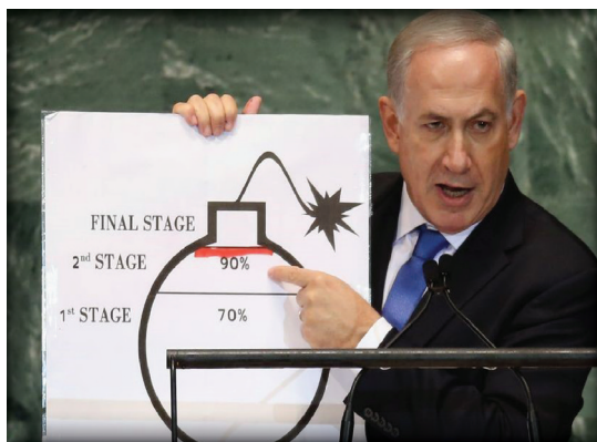
นายเนทันยาฮูได้แถลงว่าหากอิหร่านสามารถผลิตแร่ยูเรเนียมบริสุทธิ์ถึง ๙๐% จะเป็นจุดที่ไม่อาจหวนกลับและอิสราเอลจำเป็นต้องโจมตีทันที

อิสราเอลด้วยจรวดที่รุนแรงมากขึ้นทั้งจำนวนและประสิทธิภาพ จนในที่สุดจำนวนจรวดจะเกินความสามารถของระบบป้องกันภัยทางอากาศของอิสราเอล เนื่องจากความได้เปรียบทางจำนวนและราคาต่อหน่วย ซึ่งอิสราเอลยอมไม่ยอมให้ไปถึงจุดนั้น และจะต้องเข้ากวาดล้างกลุ่มฮิซบอลเลาะห์ในเลบานอนได้อย่างแน่นอน ในขณะที่อิหร่านจะยังคงไม่