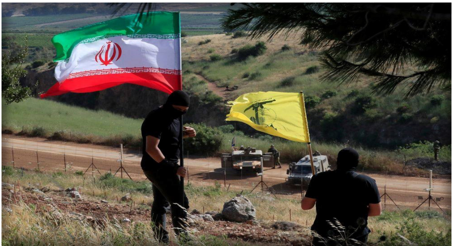
ผู้สนับสนุนฮิซบอลเลาะห์ ชูธงชาติอิหร่านและธงกลุ่มฮิซบอลเลาะห์ ทำทนายทหารอิสราเอลบริเวณชายแดนอิสราเอล-เลบานอน

เป็นกองกำลังทางทหารที่เข้มแข็งมากที่สุดในเลบานอน เข้มแข็งกว่ากองทัพเลบานอนเสียอีก มีพื้นที่อิทธิพลตามป่าเขาตอนใต้ติดชายแดนกับอิสราเอล อาจมีกำลังพลมากถึง ๔๐๐,๐๐๐ นาย พร้อมซีปนาวุธ จรวด และโดรน รวมกันมากกว่า ๑๕๐,๐๐๐ ชิ้น มีประสบการณ์การรบที่ซ้ำของ กลุ่มฮิซบอลเลาะห์ ผ่านประสบการณ์รบมาอย่างโชกโชน โดยได้เข้าช่วยรัฐบาลซีเรียปราบปราม กลุ่มนักรบต่อต้านรัฐบาลในสงครามกลางเมืองซีเรีย และเคยขับไล่กองทัพอิสราเอลออกจากเลบานอนมาแล้ว โดยระหว่างสงครามกลางเมืองในเลบานอนในปี ค.ศ.๒๐๐๖ นายทหารอิหร่านจาก IRGC ได้มีส่วนร่วมช่วยเหลือ กลุ่มฮิซบอลเลาะห์ในการต่อสู้กับกองทัพอิสราเอล ฮิซบอลเลาะห์กลายเป็นภัยคุกคามต่ออิสราเอลที่ยิ่งใหญ่ที่สุดนับแต่บัดนั้นเป็นต้นมา ทางทหารอิสราเอลรายงานว่าอิหร่านจะส่งอาวุธให้กับกลุ่มฮิซบอลเลาะห์ผ่านทางเรือในทะเลเมดิเตอร์เรเนียน และเส้นทางบกผ่านซีเรีย ในคำปราศรัยของนาย Nasrallah ผู้นำของกลุ่ม ได้กล่าวยอมรับความช่วยเหลือทางการเงินและการทหารจากอิหร่านอย่างเปิดเผย อย่างไรก็ตามอิหร่านไม่ใช่ประเทศเดียวที่สนับสนุนฮิซบอลเลาะห์ นักวิเคราะห์ที่ตะวันตกรายงานว่าผู้สนับสนุนรายอื่น ได้แก่ ตุรกี และกาตาร์ นอกจากนี้กลุ่มฮิซบอลเลาะห์ยังสร้างพรรคการเมือง ที่มีที่นั่งในสภาได้สำเร็จ ได้รับความนิยมาจากชาวเลบานอนอย่างมากอีกด้วย