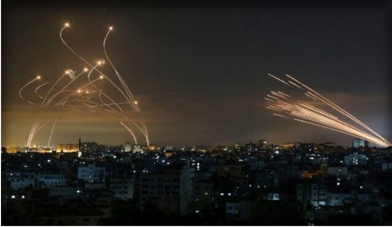
กลุ่มนักรบฮามาสได้โจมตีอิสราเอลจากพื้นที่กาซ่าทางด้านขวาด้วยจรวดในขณะที่ระบบ Iron Dome ของอิสราเอลได้ปล่อยอาวุธเข้าสกัดกั้นทางด้านซ้าย

และแรงงานต่างชาติในคิบบุชต์บริเวณชายแดนไปกว่า ๒๕๐ คนเพื่อเป็นตัวประกัน โดยกลุ่มฮามาสแถลงในภายหลังว่านี่คือปฏิบัติการ Al Agha Flood เพื่อตอบโต้ความอยุติธรรมที่อิสราเอลกระทำต่อชาวปาเลสไตน์และดูหมิ่นศาสนามาเป็นเวลานาน ความแปลกแตกต่างทั้งในด้านความหนักหน่วงรุนแรงในการโจมตีและจังหวะเวลาที่คาดไม่ถึงในแง่การทหารถือว่ากลุ่มฮามาสประสบความสำเร็จอย่างงดงาม แต่ก็ได้ชั่งน้ำหนักภัยจากการตอบโต้ของอิสราเอลที่แตกต่างจากที่ผ่านมาโดยสิ้นเชิงเช่นกัน