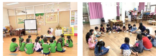
ภาพประกอบ 2 เด็กนั่งฟังครูอย่างจดจ่อใส่ใจ

1. ขั้นนำ เป็นขั้นที่ครูใช้วิธีการร้องเพลง ท่องคำคล้องจองประกอบท่าทางเพื่อเป็นการสร้างบรรยากาศในการเรียนรู้ผ่านเสียงเพลง และจังหวะของคำคล้องจอง ทำให้เด็กรู้สึกผ่อนคลายก่อนเข้าสู่การทำกิจกรรม จากนั้นครูแนะนำวัสดุอุปกรณ์เพื่อเป็นการกระตุ้นความสนใจให้เกิดความอยากรู้อยากเห็น ทำให้เด็กตั้งใจฟัง และจดจ่อกับวัสดุอุปกรณ์ที่ครูนำมา ในระยะแรกของการจัดกิจกรรมในขั้นนี้ ขณะที่ครูเริ่มต้นกิจกรรมด้วยการร้องเพลง ท่องคำคล้องจองพร้อมกับท่าทางประกอบ พฤติกรรมของเด็กบางคนจะมีท่าทางเพียงแค่นั่งมองไม่ร่วมในกิจกรรม และชักชวนเพื่อนคุย เมื่อครูชักชวนเรียกชื่อเด็กคนนั้น ๆ จึงหันกลับมาสนใจครูและกิจกรรม เมื่อครูนำวัสดุอุปกรณ์ต่าง ๆ มาให้เด็กดู เด็กส่วนใหญ่จะลุกเดินออกจากที่นั่งของตนเองเพื่อยืนดูหรือหยิบจับวัสดุอุปกรณ์นั้น ๆ หากมีเด็ก 1-2 คนลุกขึ้นมา เด็กคนอื่นจะลุกขึ้นมาเช่นเดียวกัน ครูต้องบอกให้เด็กกลับไปนั่งที่เดิมอยู่บ่อยครั้ง เมื่อจัดกิจกรรมผ่านไประยะหนึ่งในช่วงสัปดาห์ที่ 4 เป็นต้นไป จะเห็นพฤติกรรมของเด็กที่เริ่มเปลี่ยนแปลงไปเกี่ยวกับความสามารถในการกำกับตนเองของเด็กปฐมวัยที่มีการพัฒนาขึ้น เด็กจะจดจ่อใส่ใจในกิจกรรม สังเกตได้จากเมื่อเด็กร้องเพลง ท่องคำคล้องจองท่าทางไปพร้อมกับครูได้จนจบโดยไม่ชวนเพื่อนคุย ถึงแม้เนื้อเพลงหรือคำคล้องจองในบางสัปดาห์จะมีเนื้อหาที่ยาวก็ตาม และในขณะที่ครูกำลังแนะนำวัสดุอุปกรณ์ เด็กสามารถจดจ่อใส่ใจ ควบคุมอารมณ์ตนเองโดยการนั่งฟังแม้ว่าจะมีเด็กบางคนขยับตัวระง้อดูบ้าง แต่ไม่ลุกขึ้นยืนเดินมาเหมือนระยะแรก ๆ ของการจัดกิจกรรม และสามารถฟังครูแนะนำวัสดุอุปกรณ์ทีละชิ้นได้จนจบ