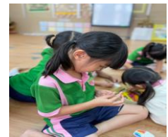
ภาพประกอบ 3 เด็กทำผลงานของตนเองอย่างตั้งใจ