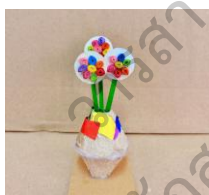
ภาพประกอบ 4 ภาพผลงานสะท้อนพฤติกรรมเด็ก เชื่อมสู่คำบรรยาย

จากข้อมูลเชิงบรรยายสะท้อนให้เห็นถึงพฤติกรรมที่แสดงออกถึงความสามารถในการกำกับตนเองของเด็กปฐมวัยจากการจัดกิจกรรมศิลปะจากการม้วนกระดาษ