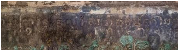
ภาพที่ 4 จารึกที่ฐานพระพุทธรูป บรรทัดแรก ... สกราชใด ๙๔๙ ตัว ผู้เปนเคาสธ...