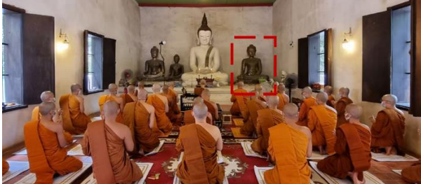
ภาพที่ 1 ภายในอุโบสถเก่า วัดเจดีย์หลวง ที่พบจารึกที่ฐานพระองค์ขวาสุดในภาพ