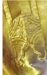
ภาพที่ 6 รายละเอียดพระพักตร์พระพุทธเมืองรายเจ้า พ.ศ. 2108 ลักษณะเป็นพระสิงห์ 1 ชัดสมาธิเพชร พระพักตร์ปรากฏร่องพระปราง โหนกแก้มชัดเจน พระเศียรมีลักษณะด้านข้างกระพองศรีระโตกว่าปกติ และชายสังฆาฏิเป็นหยักหลายกาบ มีลายดอกสี่กลีบ ที่มา: พระมหาวิทยา พลวฑฒโน (บุรีเลิศ), 2566