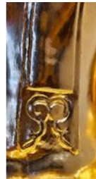
ภาพที่ 7 รายละเอียดพระพุทธรูปที่พบจารึกที่ฐานในอุโบสถวัดเจติยหลวง พ.ศ.2130 (หลังการบูรณะ ปิดทองคำเปลวแล้วเสร็จ) ลักษณะเป็นพระสิงห์ 3 ชัดสมาธิราบ พระพักตร์ปรากฏร่องพระปราง โหนกแก้มชัดเจน พระเศียรมีลักษณะด้านข้างกระพองศรีระ โตกว่าปกติและชายสังฆาฏิเป็นหยักหลายกาบ