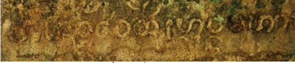
ภาพที่ 5 จารึกที่ฐานพระพุทธรูปปฏิมา