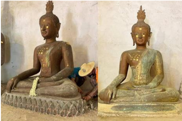
ภาพที่ 3 สภาพก่อนและหลังแกะเทาะกลีบบัวปูนซีเมนต์ เพื่อบูรณะ ปิดทองคำเปลวและใส่เศศโมลีใหม่