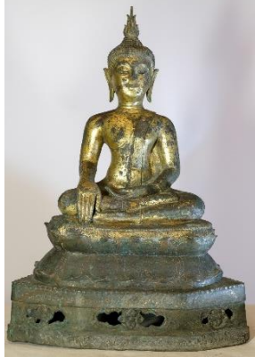
ภาพที่ 9 พระพุทธรูปที่ขุดค้นได้จาก เจดีย์หลวง เมื่อปี 2535 มีจารึก “... สักกกลาต 930...” (พ.ศ. 2111)