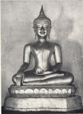
ภาพที่ 8 พระพุทธรูปวัดชัยพระเกียรติ พ.ศ. 2134 ชายสังฆาฏิหยักเช่นเดียวกัน