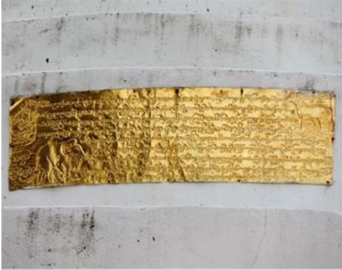
ภาพที่ 6 จารึกเจดีย์รายทิศตะวันตกเฉียงใต้ ยังไม่มีกรบวิรรตอย่างเป็นทางการ (ผู้ศึกษา, 2565)