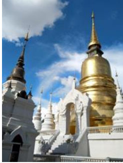
ภาพที่ 5 เจดีย์ประธานวัดสวนดอก มุมล่างซ้ายคือเจดีย์รายทิศตะวันตก (ผู้ศึกษา, 2565)

3.3 เจดีย์ราย หลังจากบูรณะเจดีย์ประธานแล้ว มีการบูรณะเจดีย์รายในลานพระเจดีย์จำนวน 7 องค์ล้อมรอบเจดีย์ประธาน โดยคำขอได้ระบุนามเจ้าภาพบูรณะเจดีย์รายซึ่งสอดคล้องกับหลักฐานอื่น ในกรณีเจดีย์รายทิศตะวันตกเฉียงใต้ซึ่งคำขอระบุถึงผู้เป็นเจ้าของว่า