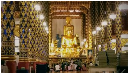
ภาพที่ 4 ภายในวิหารหลวงวัดสวนดอก พระอารามหลวง

อย่างไรก็ดีเมื่อพิจารณาโครงสร้างวิหารวัดสวนดอกในปัจจุบันจะพบว่าเป็นวิหารเปลือย ด้านกว้างมีเสาแถวละ 4 ต้น ด้านยาวแถวละ 14 ต้น รวมกันได้ 56 ต้น ซึ่งน้อยกว่าที่คำขอระบุ 2 ต้น ทว่ารับกับจำนวนชื่อ จึงอาจเป็นไปได้ว่าจำนวน 58 ในคำขอเป็นความผิดพลาดจากการเรียงพิมพ์