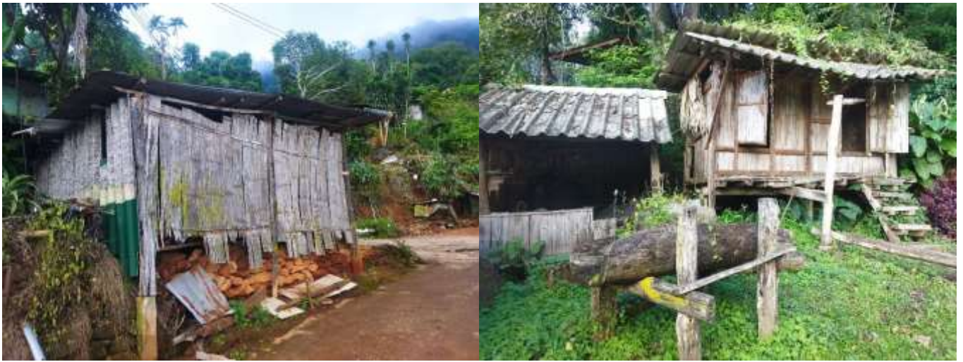
ภาพที่ 1 สภาพสิ่งปลูกสร้างของชาวบ้านบนดอยปุย

(2554) ได้อธิบายเกี่ยวกับพฤติกรรมกรรมการบริโภคไว้ว่า คนรุ่นใหม่มีการสร้างชุดความรู้ รูปแบบ และทัศนคติการบริโภคอาหาร พื้นบ้านที่เปลี่ยนแปลงไปจากรุ่นบรรพบุรุษของตน และเกิดการปรับเปลี่ยนวิถีในการบริโภคไปตามกระแสแห่งสังคมสมัยใหม่ โดยมีการบริโภคที่ถูกสุขลักษณะมากขึ้น แต่ลดปริมาณมื้อในการบริโภคอาหารพื้นบ้านลงไป อีกทั้งมีการปรับเปลี่ยนรูปแบบการกินในรูปแบบการผสมผสาน (Hybridization) กับอาหารพื้นถิ่นในรูปแบบใหม่ให้เกิดขึ้น และมีการขยายตัวออกไปยังกลุ่มผู้บริโภคอื่น นิตยา มณีวงศ์ (2561) ได้อธิบายเกี่ยวกับการเปลี่ยนแปลงไว้ว่า ความก้าวหน้าของเทคโนโลยีมีความรวดเร็ว เป็นอัตราทวีคูณทำให้โลกมีการเปลี่ยนแปลงอยู่ไม่หยุดยั้ง โลกไร้พรมแดนเชื่อมต่อกันได้ทั่วทุกส่วนของมุมโลก ทำให้เกิดการติดต่อสื่อสารระหว่างกันได้สะดวก รวดเร็วเพียงกระพริบตา การแข่งขันด้านการค้า การเปิดการค้าเสรี เศรษฐกิจ การเมือง และวัฒนธรรมที่เกิดการเปลี่ยนแปลงต่างๆ ด้านชีวิตของมนุษย์ ทำให้เกิดการปรับเปลี่ยนหรือแลกเปลี่ยนวัฒนธรรมแต่ละกลุ่มในสังคม