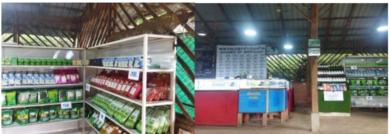
ภาพที่ 3 สินค้าชุมชนและของฝากสำหรับนักท่องเที่ยวที่สนใจ