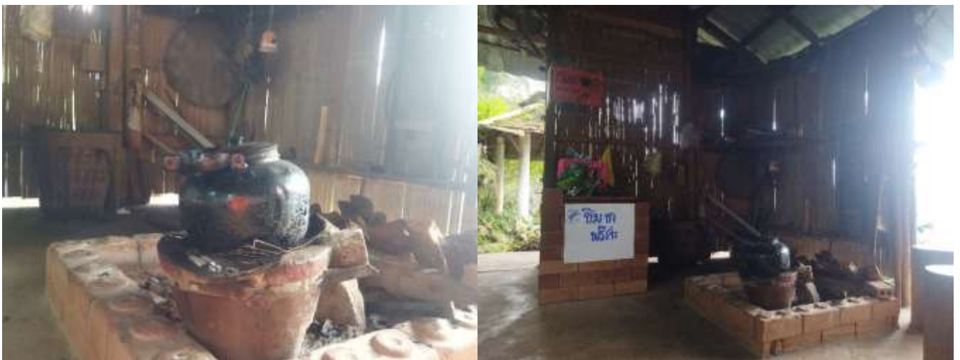
ภาพที่ 2 กาต้มน้ำโบราณสีดำและอุปกรณ์สำหรับก่อไฟต้มน้ำของร้านชากาดำ

การที่แสดงให้เห็นถึงวิธีการต้มน้ำให้ร้อนของแต่ละยุคสมัยนั้น ชี้ให้เห็นถึงการปรับเปลี่ยนวิถีการเป็นอยู่ของผู้คนที่อยู่ต่างยุคต่างสมัย มีวิธีการและวิถีการเรียนรู้ วิธีการเป็นอยู่เพื่อดำรงชีพ แตกต่างกันไป โดยอาศัยความสอดคล้องกันของธรรมชาติ สิ่งแวดล้อมที่อยู่รอบข้าง ความทันสมัยของเครื่องมือ เครื่องมือ อุปกรณ์และเทคโนโลยี ความคิดสร้างสรรค์ คิดค้นนวัตกรรมและสิ่งใหม่ๆ เพื่อตอบสนองวิถีชีวิตและความต้องการของผู้คนในสังคมตามยุคสมัยนั้นๆ การต้มน้ำด้วยวิธีโบราณที่มีกาต้มน้ำโบราณตั้งอยู่บนเตาฟืน ทำการต้มแล้วต้มอีกจนสีของกาต้มน้ำกลายเป็นสีดำ เป็นกลิ่นอายของวิถีชีวิตของผู้คนที่อยู่อาศัยในชุมชนตามชนบทไทย แสดงให้เห็นถึงความเรียบง่าย ใช้วัสดุและอุปกรณ์ที่หาได้ภายในชุมชนนำมาใช้เพื่อการดำรงชีวิต ซึ่งถือว่าเป็นเรื่องปกติของการใช้ชีวิตประจำวันของคนในชุมชน แต่เมื่อกาลเวลาผ่านไป ทั่วโลกมีวิวัฒนาการทันสมัยมากขึ้น มีความสะดวกสบายเข้ามาในการดำรงชีวิตมากขึ้น ความเป็นธรรมชาติและ การอาศัยอยู่ร่วมกันกับธรรมชาติได้ค่อยๆ หายไปจากวิถีการเป็นอยู่ของชุมชน การนำวิถีการต้มน้ำด้วยการต้มน้ำสีดำๆ แบบดั้งเดิมมาปรับใหม่ใส่ความคิดสร้างสรรค์สมัยใหม่เข้าไป จากสิ่งที่คนในสังคมปัจจุบันไม่เคยพบเจอ โดยเฉพาะกลุ่มเด็กและเยาวชน ถือเป็นสิ่งที่แปลกใหม่ เป็นสิ่งที่ไม่เคยพบเห็นมาก่อน จะเกิดการเรียนรู้และศึกษาหาข้อมูลเพิ่มเติม ส่วนกลุ่มผู้ใหญ่รุ่นพ่อรุ่นแม่จะกลายเป็นสิ่งที่สะท้อนจำให้หวนคิดถึงวิถีเก่าๆ สิ่งเก่าๆ ที่เคยใช้ชีวิตแบบยากลำบากตามมีตามเกิดในสังคมยุคสมัยที่ผ่านมา จนกลายเป็นความสร้างสรรค์เชิงวัฒนธรรมวิถีชุมชน