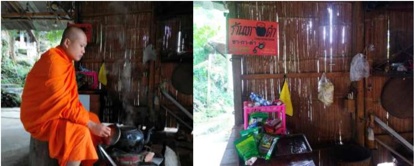
ภาพที่ 4 นึ่งต้มน้ำร้อนด้วยกาต้มน้ำแบบโบราณและฝาบ้านแบบไม้ไผ่สับฝาก

“กาดำน้ำสิดำ” เป็นอุปกรณ์เพื่อการดำรงชีพของคนโบราณจนถึงปัจจุบันอีกชิ้นหนึ่งที่ยังมีความตราตรึงใจของผู้คนทุกยุคทุกสมัย กาดำน้ำขนาดใหญ่ตั้งบนเตาถ่านหรือเตาฟืน เป็นภาพชินตาของวัยรุ่นยุค 80 และ ยุค 90 ซึ่งร้านขายกาแพโบราณ ตอนเช้าๆ ตามตลาดสด ทุกคนจะเห็นจนชินตา เรียกทั่วไปว่า “ สภากาแพ ” เป็นสถานที่แก้ปัญหาทางการเมือง มีหนังสือพิมพ์ให้อ่าน เป็นที่เล่าเรื่องราวซุบซิบนิทา เรื่องส่วนตัว เรื่องข่าวคราวบ้านเมือง และกระจายข่าวสารไปสู่ผู้คนในชุมชน หรือบางครั้งเราก็อาจเห็นกาดำน้ำใบใหญ่ๆ ตั้งบนก้อนเส้าเวลาที่ผู้หญิงอยู่ไฟจากการคลอดบุตรใหม่ ซึ่งเจ้าของบ้านจะต้องจัดเตรียมน้ำร้อนและยาตองเหล้าเสื่อ 11 ตัว และยาสมุนไพรประเภทชูกำลังไว้สำหรับต้อนรับญาติพี่น้องที่แวะเวียนมาถามข่าวสารทุกข์สุขดิบ โดยเฉพาะเวลากลางคืนจะมีญาติพี่น้องและชาวบ้านมาพูดคุยและกินน้ำร้อน (น้ำร้อน+ยาเสื่อ 11 ตัว+ยาสมุนไพร) พร้อมกับการสนทนาสัพเพเหระจนถึงยามดึก ซึ่งนั่นก็สะท้อนให้เห็นว่าการวิลาศสิ่งตั้งเดิมไม่ใช่แค่เพียง “กาดำน้ำใบเก่าๆ สีดำๆ” เท่านั้น แต่มันคือการวิลาศความเป็นวิถีที่คนๆ นั้น ได้สัมผัสและได้เคยใช้ชีวิตอยู่ในจุดๆ นั้น ตั้งแต่เกิดจนจำความได้ โดยการซึมซับรับเอาความเป็นวิถีเข้าไปเป็นจิตวิญญาณ จนทำให้เกิดความโยเยหา และเมื่อพบเจอสิ่งต่างๆ เหล่านั้นก็จะมีจิตใจ ปรารถนาล้มใจ มีความปิติยินดีต่อใจ กับสิ่งที่เป็นวิถีนั้นๆ ได้อย่างไม่มีที่สิ้นสุด