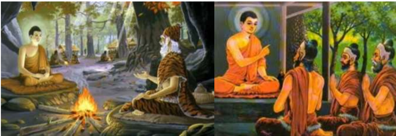
ภาพที่ 2 พระพุทธเจ้าได้ทรงพบปะสนทนากับชฎิลสามพี่น้อง