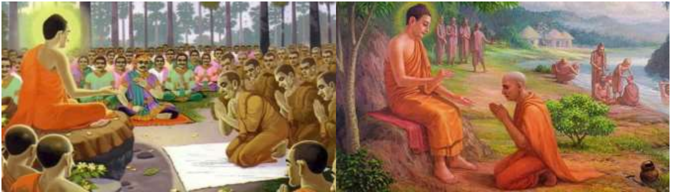
ภาพที่ 4 อรุณเวลกัสสปะและเหล่าชฎิลขอบวชในพระพุทธศาสนาพร้อมเหล่าสาวกที่ยอมรับคำสอนของพระพุทธเจ้า

โปรดชฎิลทั้งหมด 1,003 คน จนได้บรรลุเป็นพระอรหันต์ทั้งหมด (สมเด็จพระพุทธโฆษาจารย์ (ป.อ.ปยุตโต), 2564) จากเหตุการณ์นี้แสดงให้เห็นว่า ผู้บริหารและพนักงานบริษัทที่ชื่อว่า “ชฎิล” มีความเข้าใจธุรกิจ มีความเข้าใจกระบวนการผลิต ความต้องการของผู้บริโภค/ลูกค้า (ศาสนิก/สาวก) เมื่อได้ฟังธรรมแค่ครั้งเดียวก็สามารถเข้าใจ ได้ดวงตาเห็นธรรม บรรลุธรรมเป็นพระอรหันต์ทั้งหมด ซึ่งนั่นก็แสดงให้เห็นว่าชฎิลทั้งหมดมีความรู้เกี่ยวกับการปฏิบัติตน การฝึกฝนตนเอง การแสวงหาความหลุดพ้น เป็นนักบวชเช่นเดียวกันกับพระพุทธเจ้าที่มีความต้องการแสวงหาความพ้นทุกข์ เช่นเดียวกันกับกลุ่มทุนผู้ประกอบการที่มีธุรกิจเป็นแบบเดียวกัน มีลักษณะการขายสินค้าแบบเดียวกัน กลุ่มลูกค้า (ศาสนิก/สาวก) คือกลุ่มเดียวกัน เมื่อมีเทคโนโลยีสมัยใหม่หรือนวัตกรรมแบบใหม่ของบริษัทหนึ่ง ย่อมจะทำให้ผู้แข่งขันรายอื่น ๆ เสียเปรียบทันที ขณะเดียวกันหากมีกลุ่มบริษัทเกิดขึ้นใหม่ แต่ยังไม่มียุทธศาสตร์กลุ่มลูกค้า ไม่มีฐานแฟนคลับ ไม่มีอำนาจต่อรองหรือนำเสนอให้ลูกค้าและแฟนคลับได้เข้าถึงได้ง่าย จำเป็นอย่างยิ่งจะต้องนำเทคโนโลยีหรือผลิตภัณฑ์หรือนวัตกรรมใหม่ไปนำเสนอให้กลุ่มบริษัทเดิมที่ครองส่วนแบ่งทางการตลาดได้พิจารณา โดยการขอเป็นส่วนหนึ่งของบริษัทหรือขอซื้อหุ้นบางส่วน แต่ถ้าหากฐานลูกค้า กลุ่มแฟนคลับ ใกล้เคียงกัน เป็นดาวรุ่งพุ่งแรง มีผลงานโดดเด่น เห็นผลงานที่ปรากฏต่อสายตาสาธารณะชนแล้วรู้สึกประทับใจ เป็นที่ถูกตาต้องใจวัยรุ่นหนุ่มสาวและแม่ยก การควรวรมกิจการก็เป็นทางเลือกที่ดีเหมือนกันกับที่พระพุทธเจ้าและชฎิล 3 พี่น้อง ได้ร่วมมือกันควรวรมกิจการและถือได้ว่าได้รับประโยชน์ร่วมกันทั้ง 2 ฝ่าย