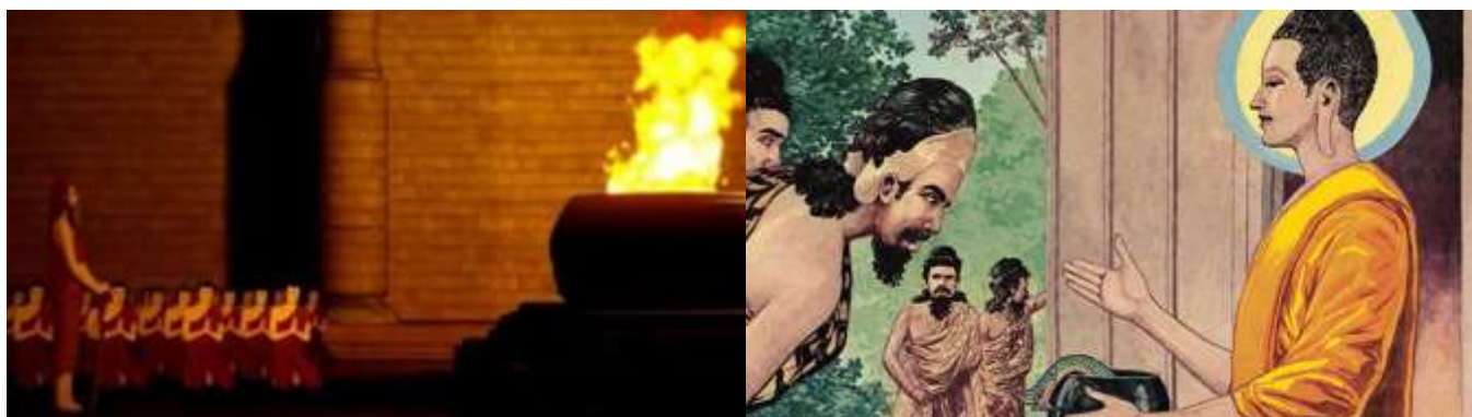
ภาพที่ 3 พระพุทธรเจ้าทรงปราบพยานาคในโรงบูชาไฟและทำให้พยานาคหมดฤทธิ์