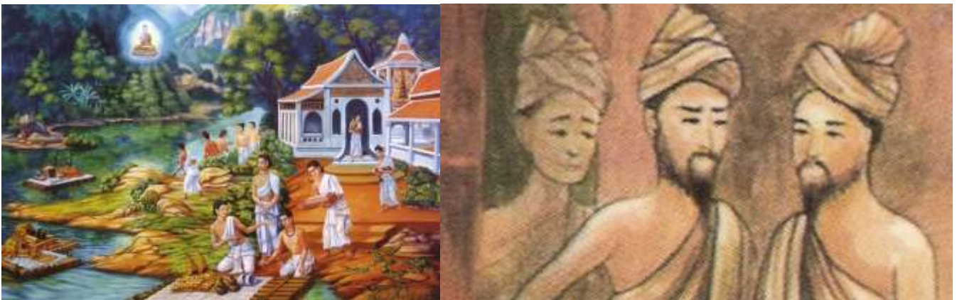
ภาพที่ 1 ชฎิลสามพี่น้อง คือ อูรวะลกัสสปะ, นทีกัสสปะ, คยากัสสปะ

ดังนั้น บทความนี้จึงเป็นการนำเสนอภาพสะท้อนการรวมตัวกันของกลุ่มกิจการทางธุรกิจหรือกลุ่มต่าง ๆ ที่มีแนวทางการทำงานอุดมการณ์และอุดมคติที่คล้ายคลึงกันหรือมีเป้าหมายเดียวกัน ซึ่งเป็นการนำเอาเหตุการณ์ที่ “พระพุทธเจ้าทรงปราบชฎิล 3 พี่น้อง” มาเปรียบเทียบและทำการวิเคราะห์เนื้อหาพร้อมกับ “กรณีการควบรวมกิจการ” ของเครือข่ายสื่อสารโทรคมนาคม 2 ค่ายยักษ์ใหญ่ เช่น True และ Dtac ที่มีการควบรวมกิจการเกิดขึ้นในปัจจุบันนี้ เพื่อเป็นการนำเสนอมุมมองทางความคิดและแง่มุมต่างๆ เกี่ยวกับการควบรวมกิจการหรือการรวมตัวกันของกลุ่มที่มีอุดมการณ์การเผยแผ่ทางความคิดเพื่อการหลุดพ้นหรือเป็นผู้นำทางศาสนาที่เกิดขึ้นในหมู่พระสงฆ์และนักบวชชฎิลในสมัยพุทธกาล ซึ่งสมัยนั้นเป็นการแย่งพื้นที่ทางความคิดและลัทธิของนักบวชเกี่ยวกับเรื่องความเชื่อการหลุดพ้น การทำให้ชีวิตที่ดีขึ้น พ้นจากทุกข์ มีความสุข