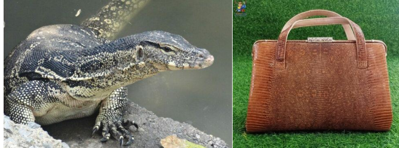
ภาพที่ 4 กระเป๋าหนังที่เป็นผลิตภัณฑ์จากหนัง (เหี้ย) (ภาพออนไลน์)