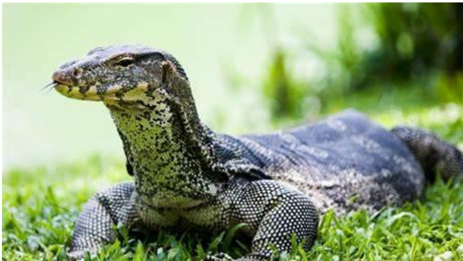
ภาพที่ 1 เหี้ย หรือที่เรียกว่า ตัวเงิน ตัวทอง หรือ วรรณุช ที่มาพร้อมกับค่านิยมและความเชื่อ (ภาพออนไลน์)