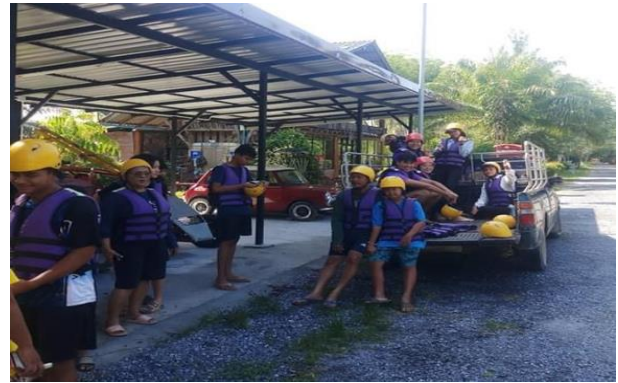
ภาพที่ 3 เจ้าหน้าที่ภาคสนามให้คำบรรยายนักท่องเที่ยว