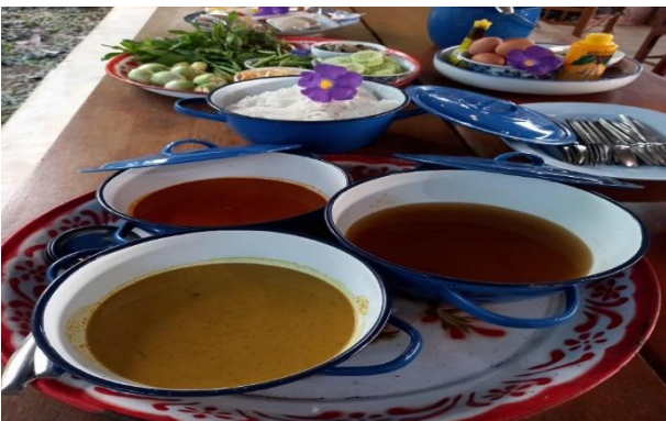
ภาพที่ 4 อาหารพื้นบ้าน (ขนมจีนน้ำยา)