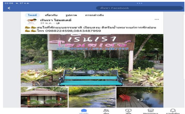
ภาพที่ 5 การโฆษณาและประชาสัมพันธ์