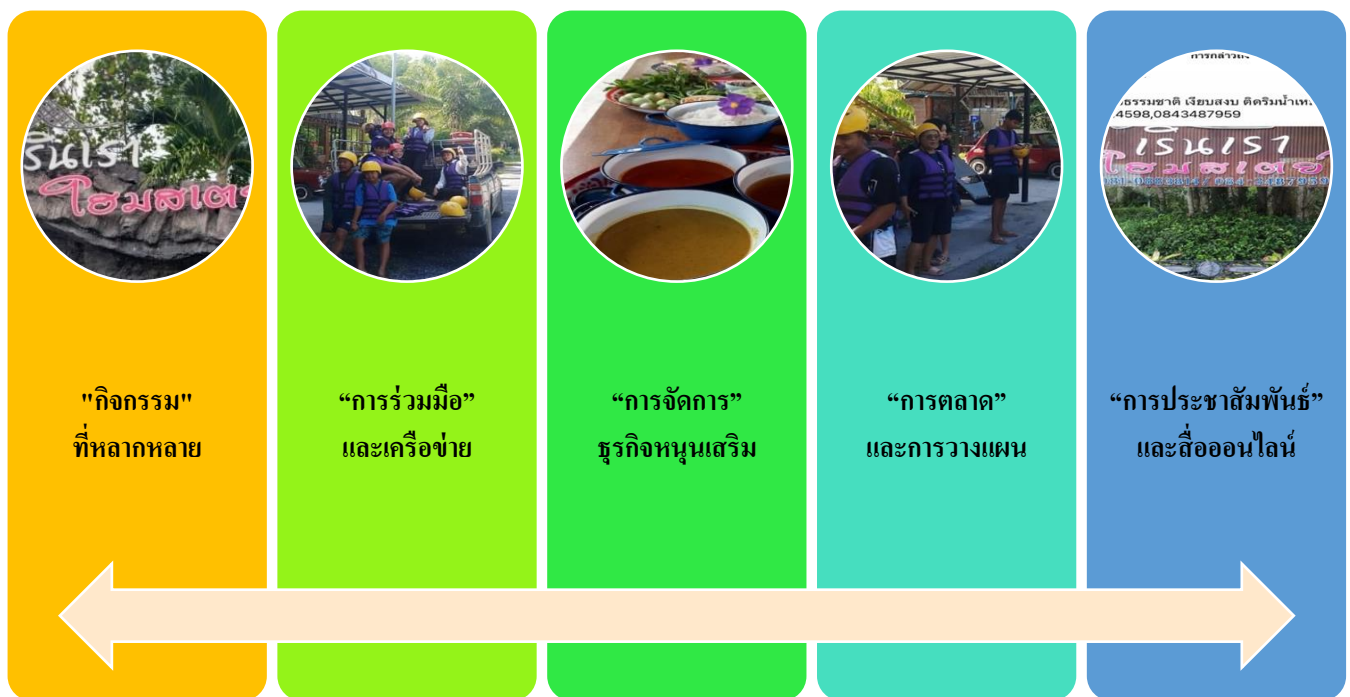
ภาพที่ 6 องค์ความรู้ใหม่ของแนวทางการส่งเสริมธุรกิจท้องถิ่น กรณีศึกษา : เรนเราโฮมสเตย์ หมู่ที่ 2 ตำบลลานข่อย อำเภอป่าพะยอม จังหวัดพัทลุง

การวิจัยเรื่อง ล่องแก่ง : แนวทางการส่งเสริมธุรกิจท้องถิ่น กรณีศึกษา : เรนเราโฮมสเตย์ หมู่ที่ 2 ตำบลลานข่อย อำเภอป่าพะยอม จังหวัดพัทลุง สามารถสรุปเป็นองค์ความรู้ใหม่ในลักษณะ “5ก” ดังนี้