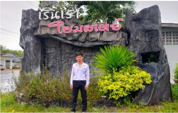
ภาพที่ 2 ป้ายทางเข้าธุรกิจล่องแก่งเรินเราโฮมสเตย์

3.4 แนวทางการแก้ปัญหาการพัฒนาธุรกิจล่องแก่ง การพัฒนาส่งเสริมแหล่งท่องเที่ยวโดยชุมชน โดยให้หน่วยงานต่างๆ ได้เข้ามาช่วยพัฒนาส่งเสริมสถานที่ให้เป็นแหล่งท่องเที่ยวโดยชุมชนเอง ผู้ประกอบการในพื้นที่ควรสร้างหน้าเพจเว็บไซต์ของล่องแก่งเรินเราโฮมสเตย์ให้ดึงดูดนักท่องเที่ยว และการดูแลปรับปรุงระบบต่างๆ ในพื้นที่ก็เป็นเรื่องสำคัญต้องแก้ไขปัญหาคำแนะนำจากผู้ที่เกี่ยวข้อง และเผยแพร่ของดีประจำตำบลเพื่อเป็นการเชิญชวนให้นักท่องเที่ยวเข้ามาในพื้นที่ และเรินเราโฮมสเตย์มากขึ้น พร้อมพยายามจัดหางบประมาณจากหน่วยงานทางจังหวัดที่เกี่ยวข้องในการช่วยพัฒนาส่งเสริมการตลาดทางการท่องเที่ยวของเรินเราโฮมสเตย์