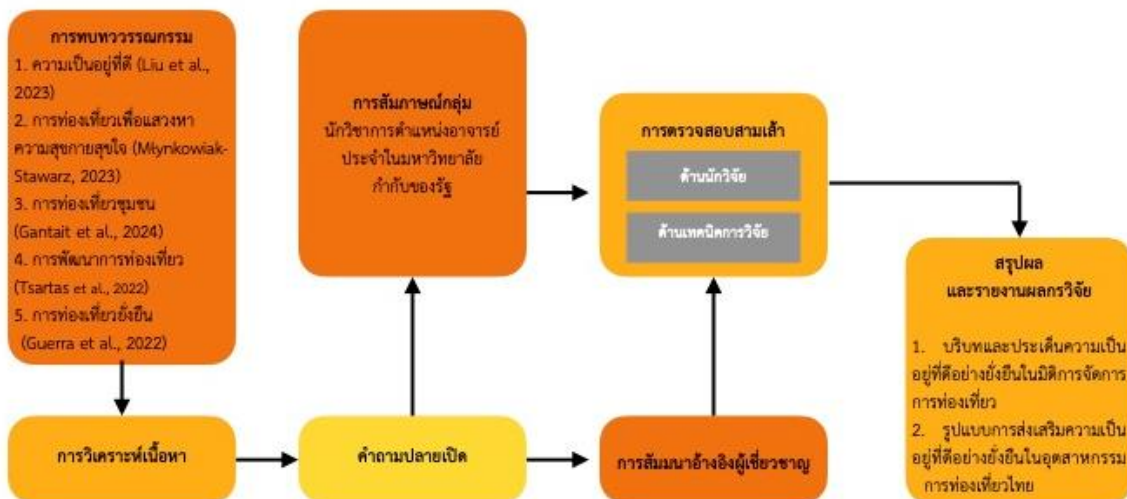
ภาพที่ 1 กรอบแนวคิดการวิจัยเชิงขั้นตอน

ผู้วิจัยเริ่มต้นการรวบรวมข้อมูลทุติยภูมิจากการทบทวนวรรณกรรมร่วมกับการวิเคราะห์เนื้อหาจากแนวคิดทฤษฎีความเป็นอยู่ที่ดี การท่องเที่ยวเพื่อแสวงหาความสุขกายสุขใจ การพัฒนาการท่องเที่ยว การท่องเที่ยวยั่งยืน และงานวิจัยที่เกี่ยวข้อง เพื่อการออกแบบข้อความคำถามปลายเปิดเพื่อใช้ในการเก็บรวบรวมข้อมูลปฐมภูมิจากกลุ่มผู้ให้ข้อมูลสำคัญแบ่งออกเป็น 2 ระยะด้วยการสัมภาษณ์กลุ่มย่อย นำผลการศึกษามาสร้างสมมติฐานชั่วคราวเพื่อเก็บข้อมูลด้วยเทคนิคการสัมมนาอ้างอิงผู้เชี่ยวชาญ เมื่อได้ข้อมูลครบถ้วนแล้วจึงเข้าสู่การตรวจสอบความน่าเชื่อถือด้วยทฤษฎีสามเส้า มีการวิเคราะห์และตีความข้อมูลให้สอดคล้องกับวัตถุประสงค์การวิจัยมีรายละเอียดตามภาพที่ 1 ดังนี้