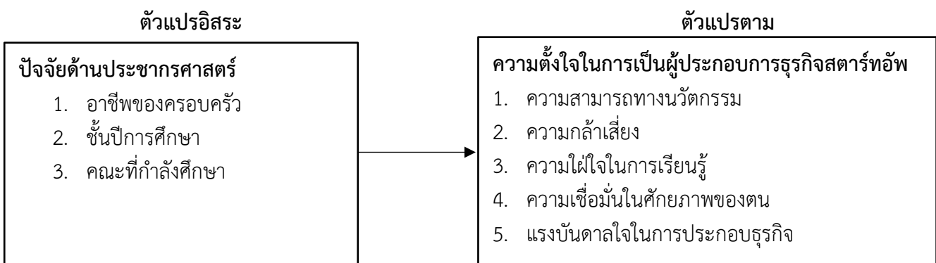
ภาพที่ 1 กรอบแนวคิดในการวิจัย

ที่มา: วันวิสาข์ โชคพรหมอนันต์, (2552); ขวัญกลม ดอนขวา และคณะ, (2562); อาทร พร้อมพัฒนภาค, (2562); ภัทรานิษฐ์ สรเสริมสมบัติ, (2563); และอนวัต สงสม, (2566).