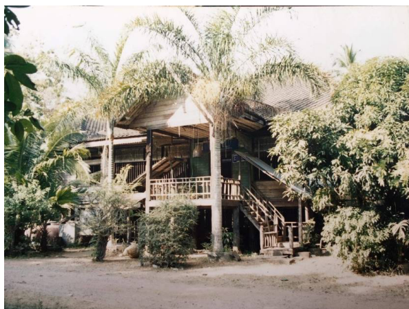
ภาพที่ 2 ศาลาหลังเก่าวัดโคกศรีสะเกษเป็นภาพที่นำมาจากเอกสารของวัด ที่มา: คณะผู้วิจัย

วัดนี้มีพื้นที่มากกว่า 100 ไร่ และเจริญรุ่งเรืองมาตามยุคสมัยมาเรื่อย ๆ โดยปัจจุบันนี้เจ้าอาวาสเป็นองค์ที่ 12 ส่วนสมัยที่เจริญรุ่งเรืองที่สุดคือสมัยหลวงพ่อบัว กล่าวคือ มีการสร้างกุฏิหลังใหญ่ มีศาลาเป็นหอแจก และใช้เป็นสถานที่เรียนในหมู่บ้านนี้ด้วย ที่นี้เป็นสำนักเรียนบาลีที่ใหญ่ที่สุดในอำเภอปักธงชัย มีพระภิกษุสามเณรมาศึกษาเล่าเรียน รวมถึงหลวงพ่อบัวได้มีการสร้างกุฏิที่วัดป่าบนโคกเพื่อให้พระและญาติโยมที่มาบวชที่สนใจในการปฏิบัติไปอยู่ที่นั่น สำหรับชื่อวัดโคกศรีสะเกษยังมีคำบอกเล่าว่ามีผู้ให้ความหมายของคำว่าศรีสะเกษไว้ว่า “จอมแห่งนักปราชญ์” ดังนั้นวัดโคกศรีสะเกษจึงหมายความว่าวัดนี้มีจอมแห่งนักปราชญ์เพราะว่าเป็นสถานศึกษาเรียนบาลีของคนเก่ง 1 ที่นี้ แต่หลวงพ่อบัวท่านอายุไม่มาก มีโยมไม่ชอบ เขาจึงเอายาสั่งใส่กับอาหารเมื่อท่านฉันอาหารก็โดนยาสั่งจึงทำให้มรณภาพ (พระพิพัฒน์อิสริคุณ, สัมภาษณ์ 27 มกราคม 2565)