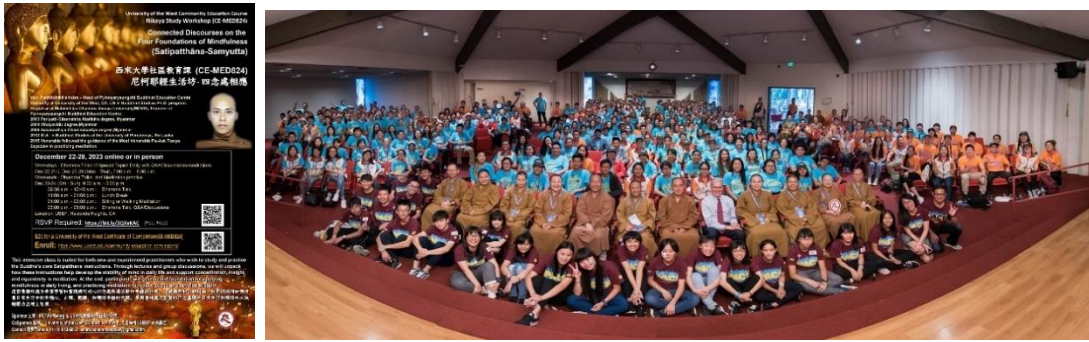
ภาพที่ 5 ภาพสื่อสารการจัดการเรียนการสอน และกิจกรรมของมหาวิทยาลัย (University of the West, 2023)