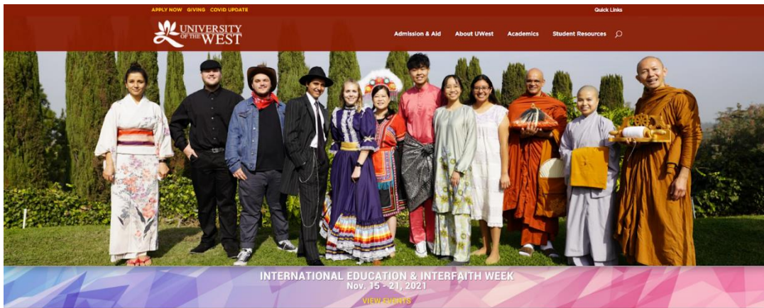
ภาพที่ 1 สื่อออนไลน์ของมหาวิทยาลัย ผ่านเว็บไซต์ https://www.uwest.edu/ ที่สะท้อนถึงความเป็นพระพุทธศาสนาแบบตะวันออกกับการเชื่อมโยงสู่ความเป็นนานาชาติ (University of the West, 2021)