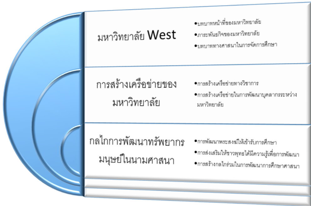
ภาพที่ 8 องค์ความรู้ที่ได้

องค์ความรู้ใหม่ สะท้อนให้เห็นว่า มหาวิทยาลัยพระพุทธศาสนาเป็นกลไกสำคัญในการพัฒนาทรัพยากรมนุษย์ในพระพุทธศาสนา ผ่านสถาบันการศึกษา และใช้กระบวนการดังกล่าวเป็นเครื่องมือในการเชื่อมประสานความแตกต่างทางชาติพันธุ์โดยพระพุทธศาสนาเป็นเครื่องมือในการเชื่อมประสานระหว่างกัน ตามภาพที่ 8