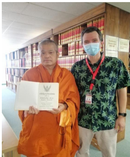
ภาพที่ 6 คณะร่วมสังเกตการณ์การและบทบทหน้าที่ของมหาวิทยาลัยเวสต์ 15 พฤศจิกายน 2564

ภาษาอังกฤษ ซึ่งจะเป็นเครื่องมือ หรือสิ่งสำคัญต่อการเรียนรู้และเชื่อมโยงกับพระพุทธศาสนาได้ รวมทั้งก่อให้เกิดการขับเคลื่อนเป็นกลไกร่วมทางพระพุทธศาสนาร่วมกัน เป็นทั้งการเรียนรู้เพื่อการพัฒนา และเป็นการเรียนรู้เสริมสร้างพัฒนาการให้เกิดขึ้นแก่คนในสังคมประเทศชาตินี้ร่วมกัน จุดเด่นคือเป็นมหาวิทยาลัยพุทธศาสนา จุดเชื่อมคือการสร้างการเชื่อมโยงระหว่างกันระหว่างมหาวิทยาลัย และที่สำคัญยิ่งคือพัฒนาให้เป็นเครือข่ายร่วมกันในการพัฒนาคนหรือบุคลากรทางศาสนาให้มีความเชื่อมโยงเป็นปฏิสัมพันธ์ระหว่างกันได้ด้วย