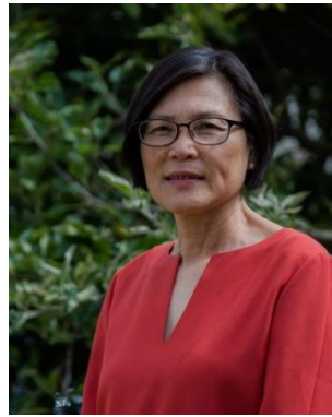
ภาพที่ 4 Minh-Hoa Ta ประธานมหาวิทยาลัยคนปัจจุบัน