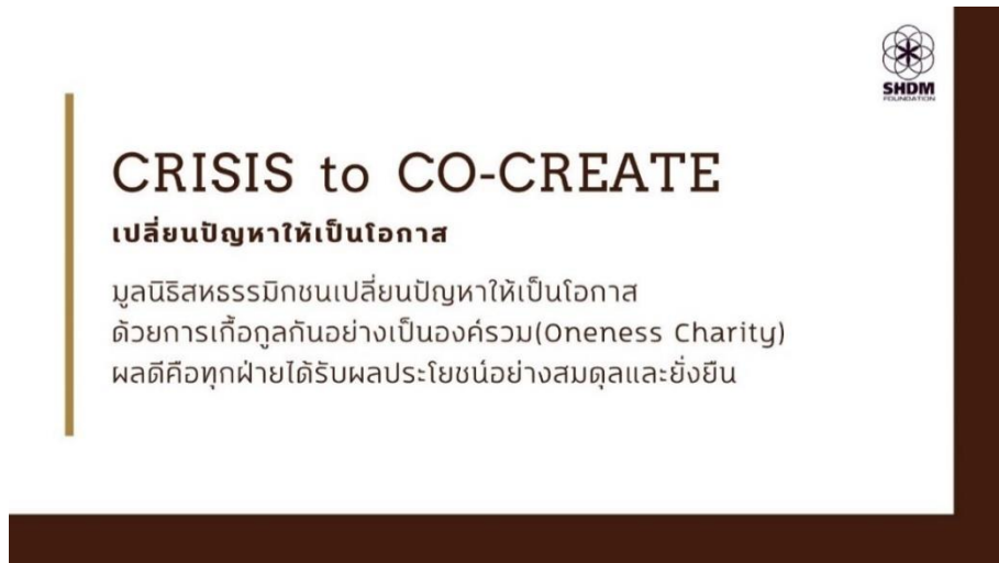
ภาพที่ 2 แนวคิดพื้นฐานของโครงการกัลปนา มูลนิธิสหธรรมิกชน

4) คนไทยยังมีคนขาดแคลนข้าว ยังมีคนไทยอีกจำนวนมากที่ขาดแคลนข้าว ทั้งที่ประเทศไทยสามารถปลูกข้าวได้เป็นจำนวนมาก