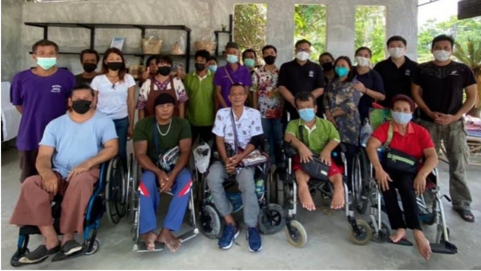
ภาพที่ 4 คณะกรรมการและที่ปรึกษาสมาคมคนพิการ จังหวัดอุทัยธานี

ปัจจุบันมูลนิธิสหธรรมิกชน ร่วมกับสมาคมคนพิการจังหวัดอุทัยธานี ได้เริ่มโครงการพัฒนาพื้นที่ ในบริเวณพื้นที่ของสมาคมฯ เพื่อให้เกิดสังคมต้นแบบแห่งการเกื้อกูลอย่างยั่งยืน โดยองค์ประกอบหลัก ของโครงการต้นแบบนี้ประกอบด้วย