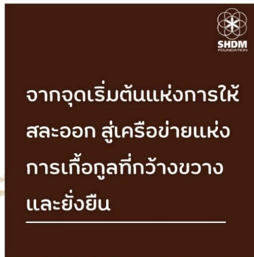
ภาพที่ 3 วิสัยทัศน์ของโครงการกัลปนา มูลนิธิสหธรรมิกชน