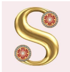
ภาพที่ 1 โลโก้มูลนิธิสหธรรมิกชน

- รูปตัวอักษรภาษาอังกฤษ “เอส” สีทอง ปลายทั้งสองด้านมีวงกลมสีแดง ใจกลางวงกลมเป็นสีขาว - มีความหมายว่า “เอส” สีทอง แทนเส้นทางไปสู่สันติและความสงบสุข ที่เชื่อมระหว่างวงกลมสีแดง แทนการชำระอดีตตัวตน เข้าสู่สีขาวใจกลางวงกลมเป็นสัญลักษณ์แทนสมมติและวิมุติ (ทางโลก และทางธรรม)