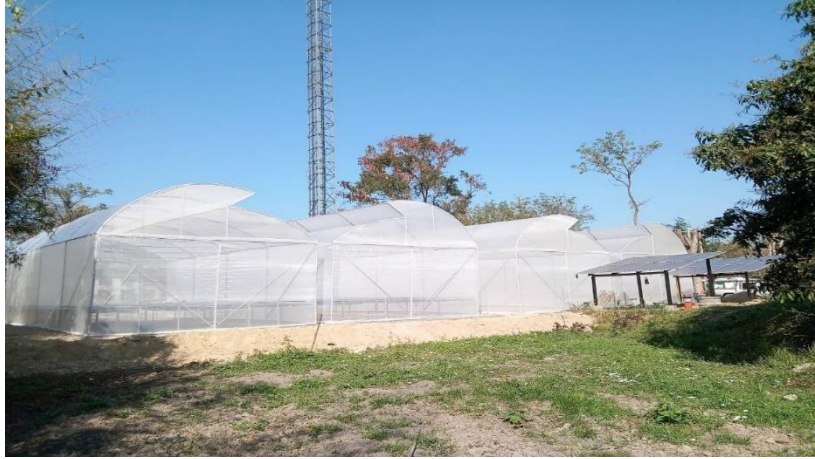
ภาพที่ 8 ระบบโรงเรือนเกษตรอัจฉริยะ (Smart Farm) ที่กำลังดำเนินการติดตั้งระบบในขณะนี้