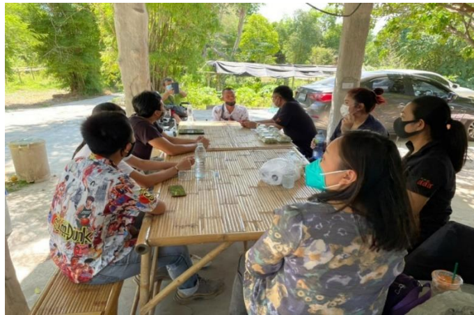
ภาพที่ 5 การประชุมขับเคลื่อนโครงการต้นแบบแห่งการถือกุอย่างยั่งยืน

จากการขับเคลื่อนร่วมกันกับทางสมาคมฯ และภาคีเครือข่ายจึงดำเนินงานดังนี้ การดำเนินงานขั้นที่ 1 การจัดหาแหล่งน้ำ