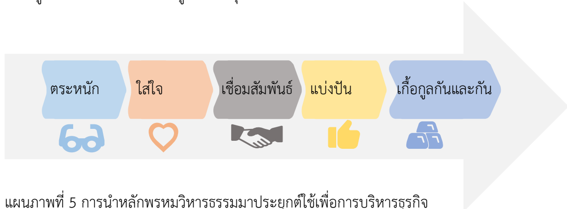
แผนภาพที่ 5 การนำหลักพรหมวิหารธรรมมาประยุกต์ใช้เพื่อการบริหารธุรกิจ

การนำหลักพรหมวิหารธรรมมาประยุกต์ใช้เพื่อการบริหารธุรกิจสามารถเกิดประโยชน์ได้ทั้งในส่วนของบุคคล ความสัมพันธ์ในเชิงสร้างสรรค์ ตลอดจนส่งเสริมธุรกิจแบบแบ่งปันได้ โดยสามารถสรุปความรู้ใหม่เป็นเชิงกระบวนการสู่การประยุกต์ใช้ได้ดังนี้