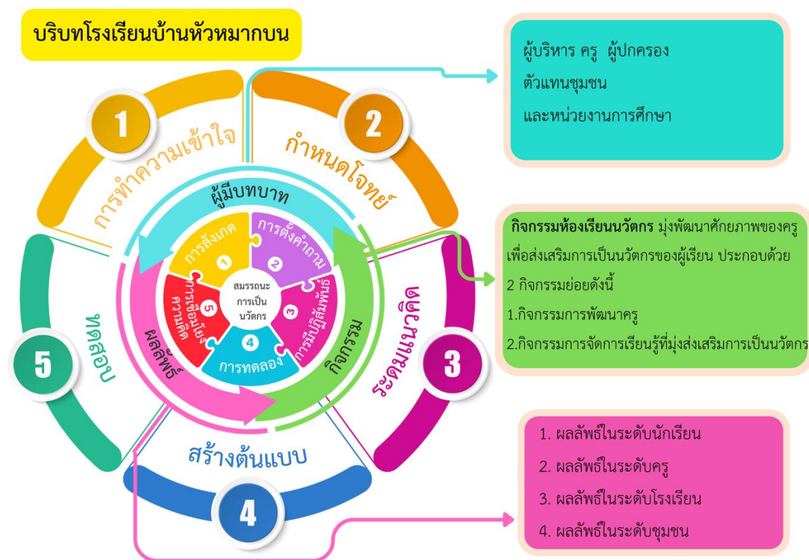
ภาพ 4 ระบบนิเวศนวัตกรรมเพื่อส่งเสริมการเป็นนวัตกรรมของผู้เรียนระดับประถมศึกษา

ระยะที่ 3 : ผลการประเมินประสิทธิผลของระบบนิเวศนวัตกรรมที่สะท้อนความเปลี่ยนแปลงในทุกมิติอย่างรอบด้าน ประกอบด้วยการดำเนินงาน 1 วงจร คือ วงจรที่ 5 ประเมินประสิทธิผลของระบบนิเวศนวัตกรรมของโรงเรียนบ้านหัวหมากบน โดยใช้กรอบการประเมินที่เป็นระบบด้วยการประยุกต์ใช้รูปแบบ CIPP เพื่อครอบคลุมภาพรวมของระบบนิเวศนวัตกรรมที่พัฒนาขึ้นทุกมิติของระบบนิเวศนวัตกรรมทั้งด้านบริบท ปัจจัยนำเข้า กระบวนการ และผลผลิต ทั้งนี้นำมาใช้ร่วมกับรูปแบบการประเมินแบบมีส่วนร่วม เพื่อเปิดโอกาสให้ผู้มีส่วนได้ส่วนเสียทุกฝ่ายมีส่วนร่วมเป็นผู้ประเมินสะท้อนตนเอง (Reflection) ดังปรากฏในตาราง 1