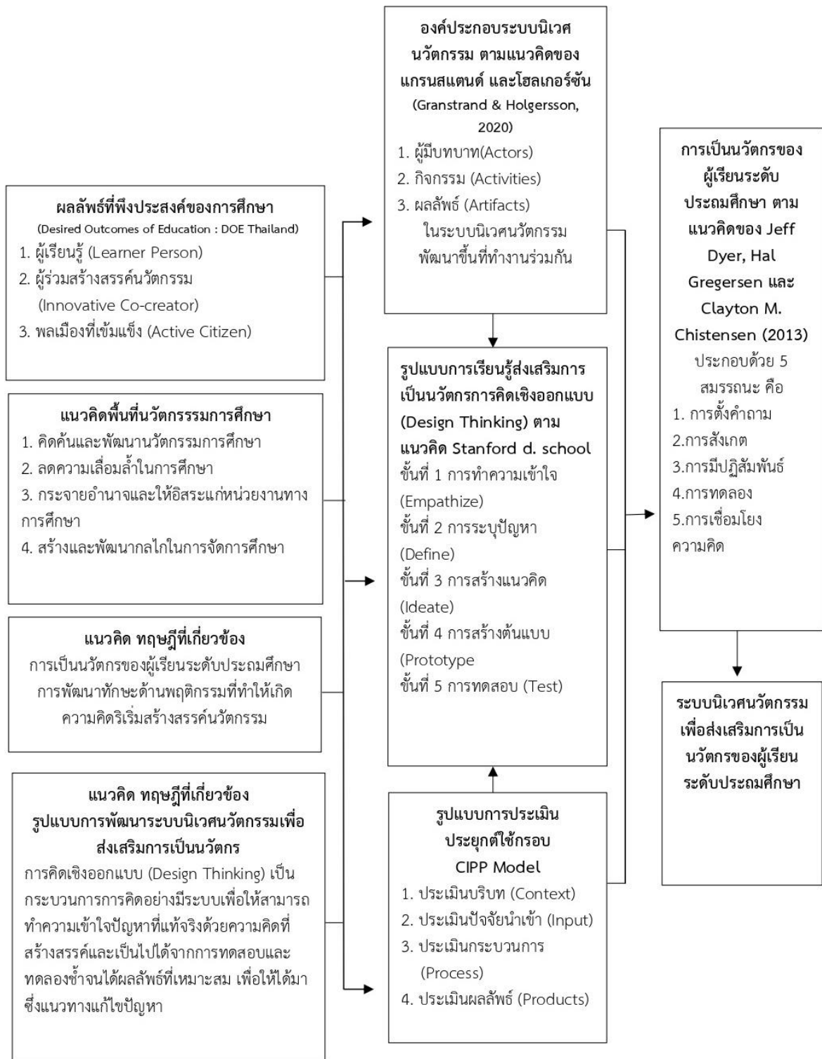
ภาพ 1 ภาพแสดงกรอบแนวคิดการวิจัย