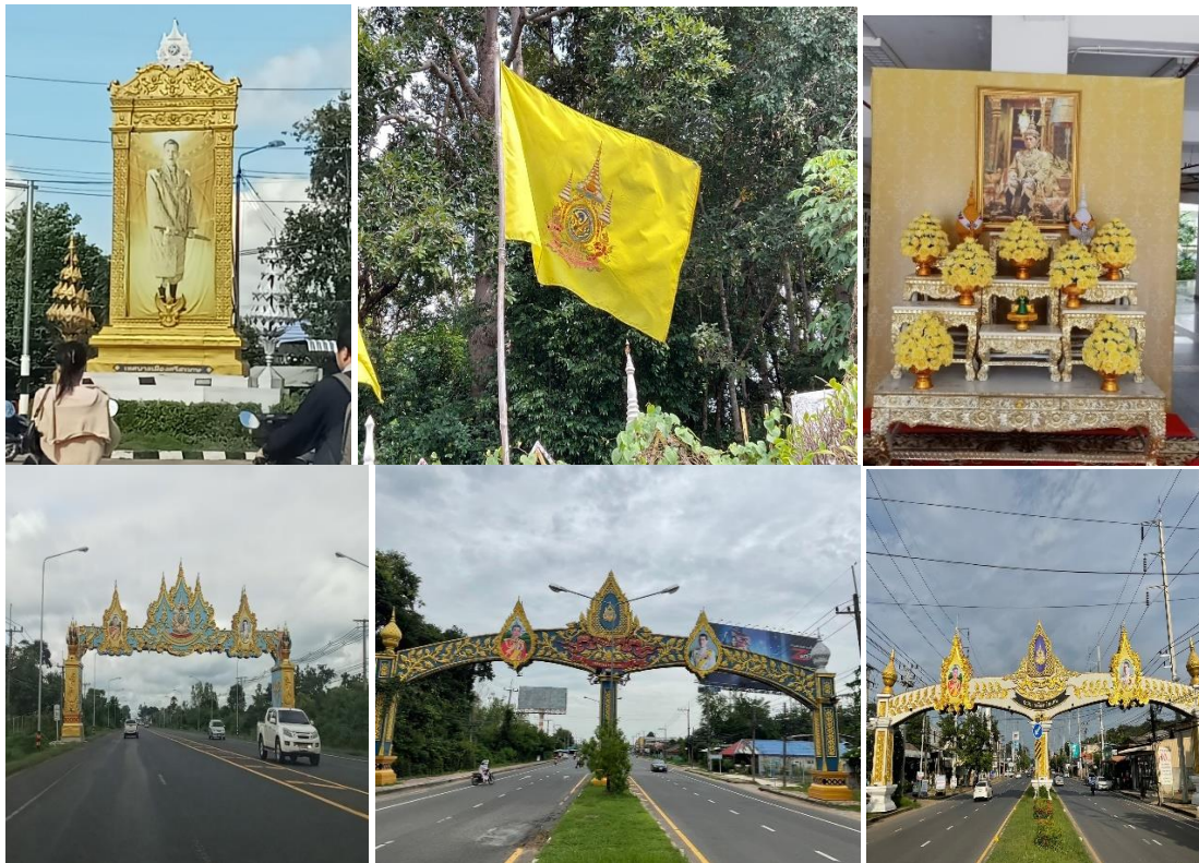
รูปภาพที่ 2-7 ตราสัญลักษณ์ที่ถูกเผยแพร่ตามสถานที่สาธารณะต่างๆ

ในวโรกาสที่เป็นมงคลยิ่งนี้ สำนักนายกรัฐมนตรีได้ออกประกาศเชิญชวนหน่วยงาน องค์กรทั้ง ภาครัฐบาลและภาคเอกชน รวมทั้งประชาชนทั่วไปได้ประดับตราสัญลักษณ์ตามสถานที่อาคารของหน่วยงาน และบ้านเรือนไว้ในบริเวณที่เหมาะสม เพื่อเป็นการถวายราชสักการะและแสดงความจงรักภักดีแด่องค์ พระบาทสมเด็จพระเจ้าอยู่หัว โดยให้เริ่มประดับตราสัญลักษณ์พระราชพิธีมหามงคล 72 พรรษา ได้ตั้งแต่วันที่ 1 มกราคม พุทธศักราช 2567 จนถึงสิ้นปีพุทธศักราช 2567 ดังที่มีปรากฏได้พบเห็นตราสัญลักษณ์พระราชพิธี มหามงคล 72 พรรษา ประดับไว้ตามสถานที่ต่างๆ อาคาร ธงตราสัญลักษณ์ โต๊ะหมู่บูชาที่หน้าส่วนราชการ เอกชน รัฐวิสาหกิจ หน้าบ้านเรือนประชาชน รวมถึงซุ้มเฉลิมพระเกียรติที่ถนนสายหลักและในชุมชนเป็นที่ แพร่หลายไปทั่วประเทศ